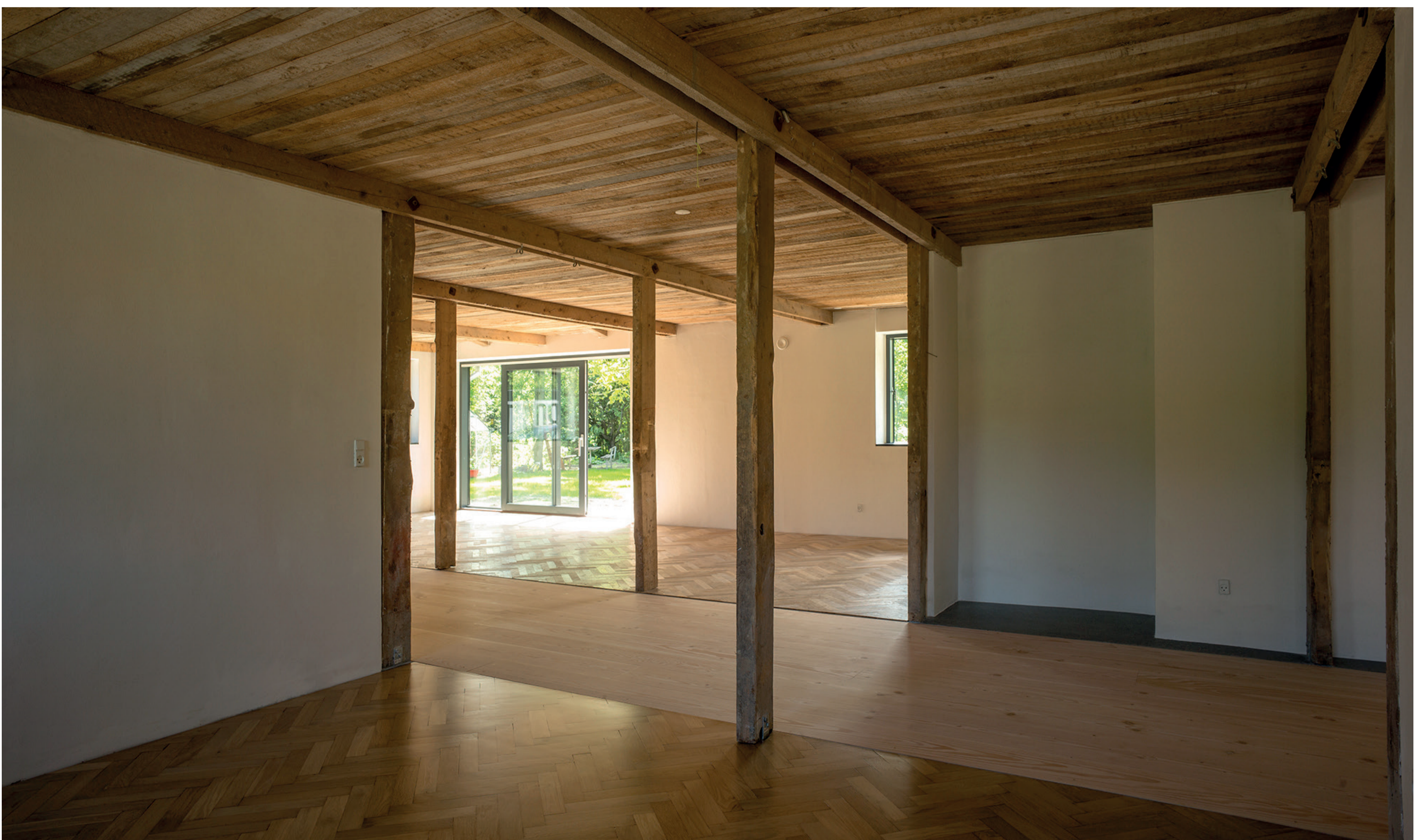
Boligen efter omdannelse, 2014