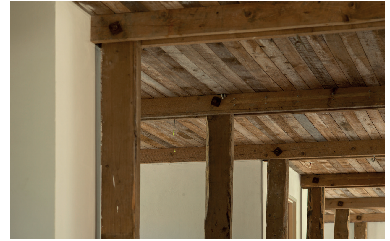
Staldens trækonstruktion efter omdannelse, 2014