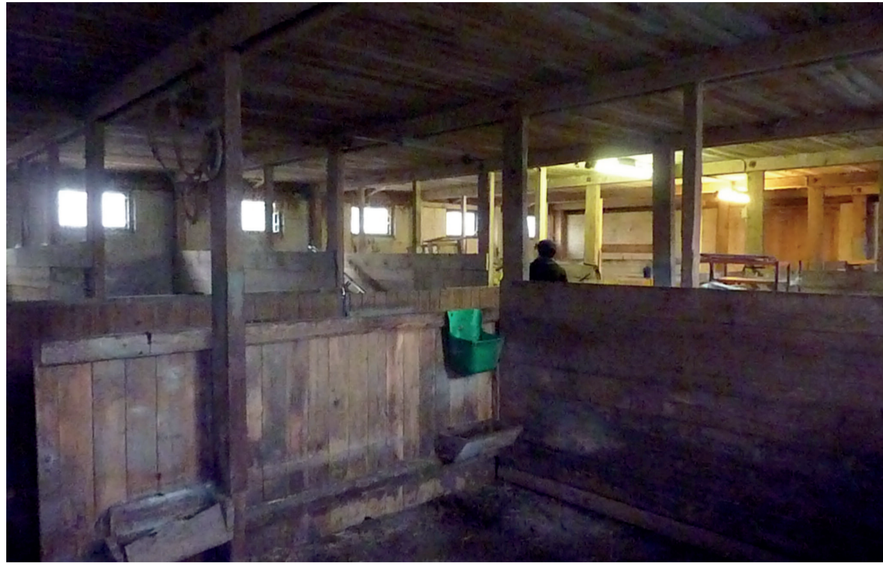
Staldens indre før omdannelse, 2013