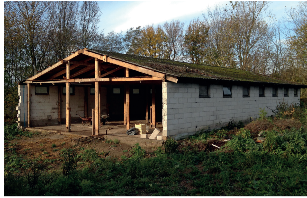
Stalden før omdannelse, 2013