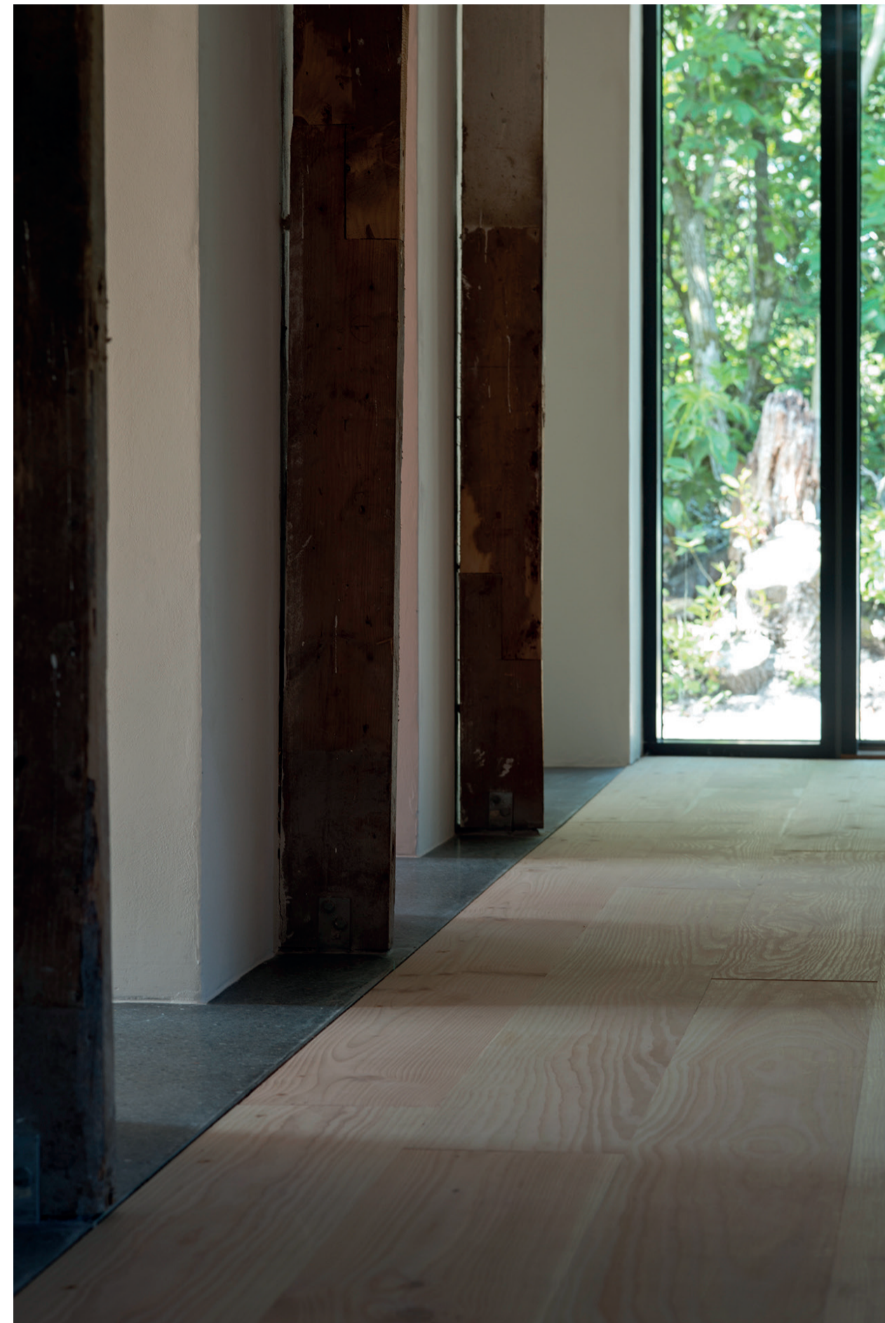
Staldens gang efter omdannelse, 2014

BO FROST architects Obstrupvej 25 8320 Mårslet www.bo-frost.dk